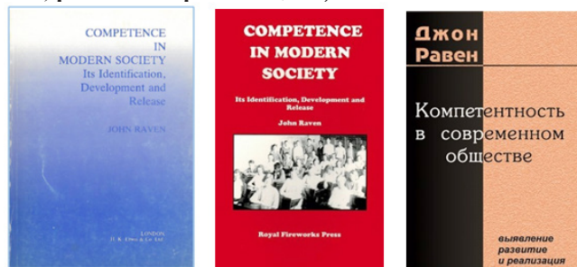
Рисунок 1 – Книга ‘Competence in Modern Society. Its Identification, Development and Release’ и её перевод на русский язык «Компетентность в современном обществе: выявление, развитие и реализация»

‘Competence in Modern Society. Its Identification, Development and Release’ (Компетентность в современном обществе. Её идентификация, развитие и высвобождение) (перевод на русский язык: «Компетентность в современном обществе: выявление, развитие и реализация»)