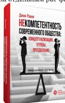
Рисунок 4 – Книга «Некомпетентность современного общества: концептуализация, угрозы, преодоление»

В электронном виде книга доступна на веб-сайте ‘Eye On Society’ ( http://www.eyonsociety.co.uk ), где каждая глава представлена отдельным pdf-файлом.